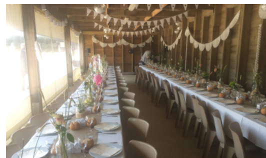
exemple de disposition

Mail : animation@plougonvelin.fr www.fort-de-bertheaume.bzh